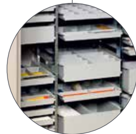
Bis zu 4080 verschiedene Artikel in 24 verschiedenen, frei wählbaren Kassetten-Ausführungen.