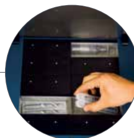
Bequeme Entnahme der Artikel.